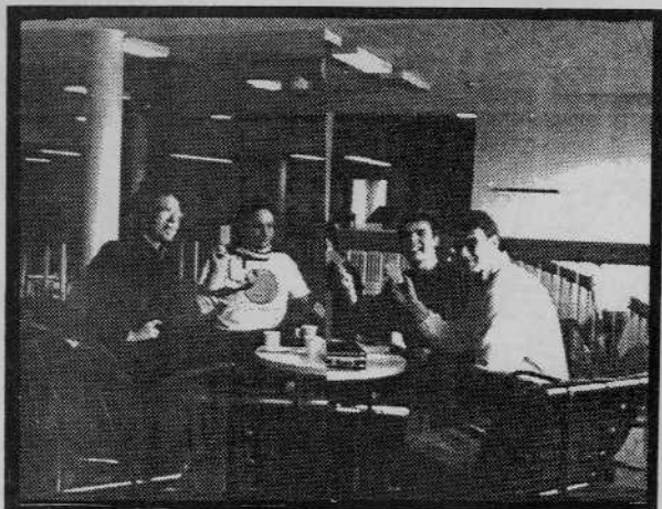
Inffojaoksen demokraattista päätöksentekoa esikuvamme, toveri Josifin tapaan. (Epähenkilö redusoitu)