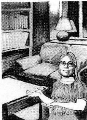
Art by Pauli Salmi

miltei nerokkaan funktionaalista kompaktia keittiötä. Sitten kuuluu valokuvaajan haltioitunut huudahdus hänen löydettyään kotoisen olohuoneen vierestä myös työhuoneena toimivan kirjaston. Ihmettelimme, mistä Laura on saanut hankittua näin edustavan valikoiman vanhoja ajan patinoimia huonekaluja. "Minulla on todella ollut onni matkassa," hän hymyilee, "olen tehnyt varsinaisia löytöjä käytettyjen tavaroiden kauppiaiden valikoimista. Lisäksi olen saanut, kuvitelkaa, ilmaiseksi monia tyylihuonekaluja sukulaisiltani, jotka eivät selvästikään ymmärtäneet niiden arvoa!". Makuuhuone on yläkerrassa, mutta Laura ilmoittaa: "Sinne en päästä toimittajia."